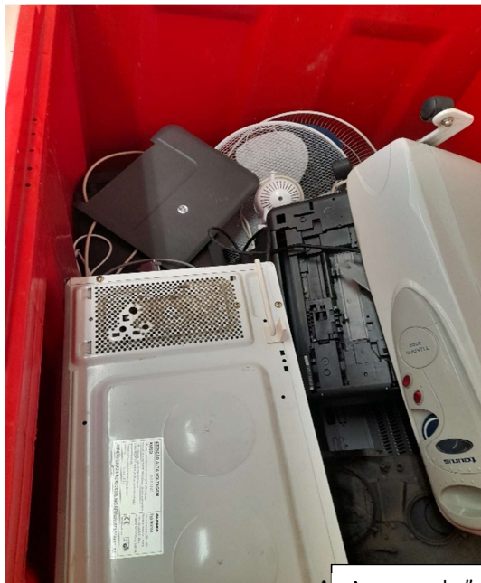
A nossa cuba"

A ação decorre até ao dia 30 de junho de 2024.